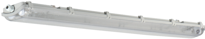
● DICHT N-218/4LED/PS

oprawa pyłoszczelna / dustproof lighting fitting